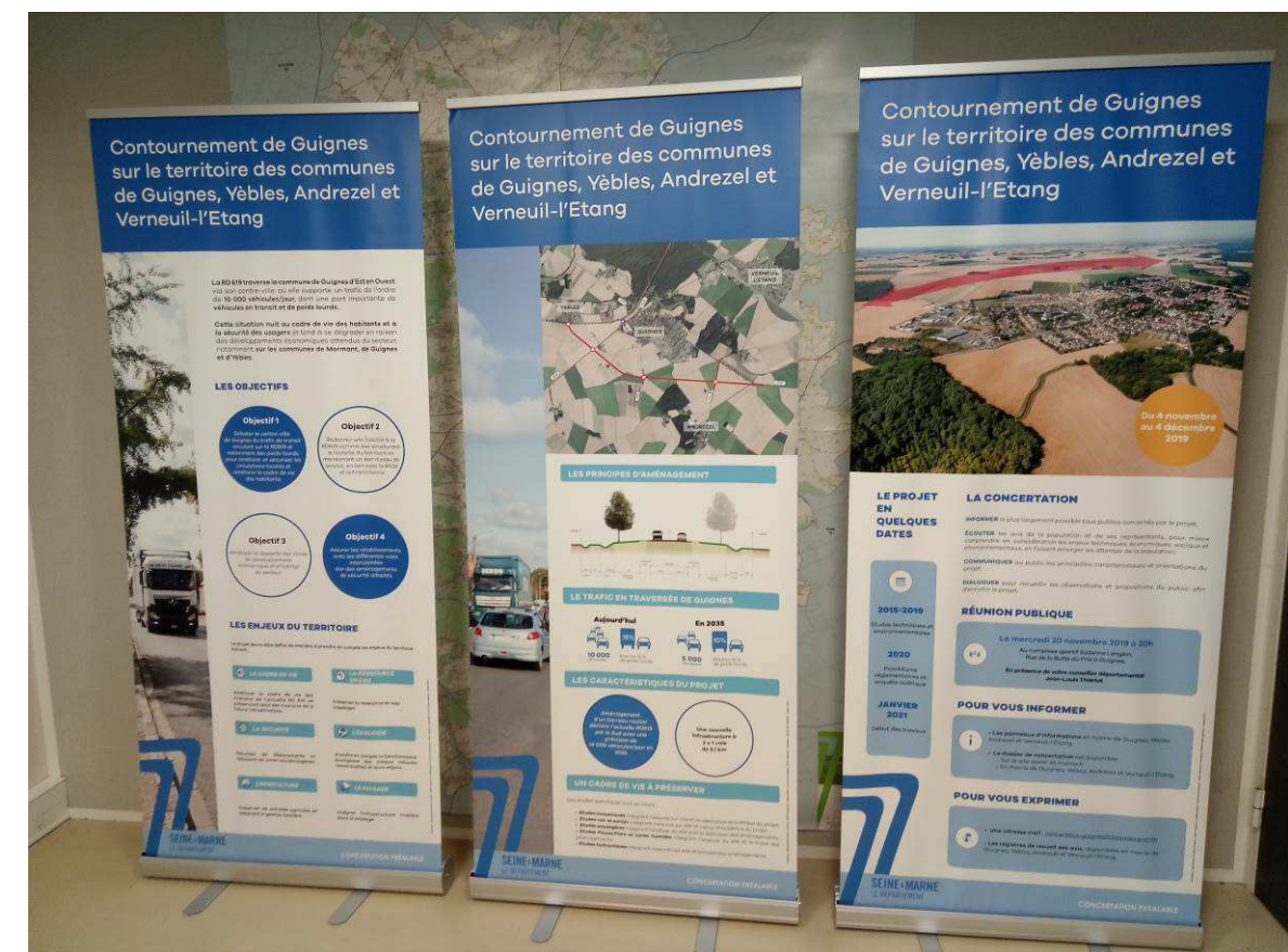
Exposition itinérante de la concertation préalable

Pour faciliter l'installation des panneaux dans ces différents lieux, ils ont été imprimés sur des bâches souples et dotées d'un système d'enrouleur mécanique.