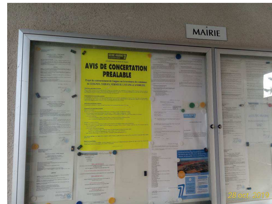
Affichage en mairie

Un affichage de 3 panneaux au format A0 dans les mairies concernées.