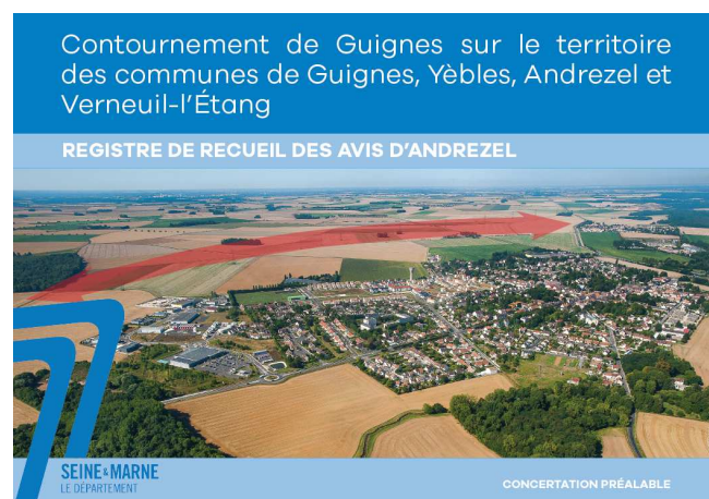
Registre d'expression en mairies

Quatre registres d'expression ont été mis à disposition dans les mairies de Guignes, Yèbles, Andrezel et Verneuil-l'Étang pour consigner les avis et observations de chacun.